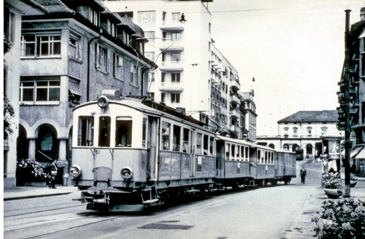
Komposition der ESZ „Elektrische Eisenbahn des Kantons Zug“ an der Alpenstrasse, Ansicht ca. 1950